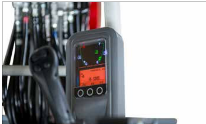
Nuevo display de vidrio laminado resistente a rayaduras, con elementos de monitoreo visual y acústico.