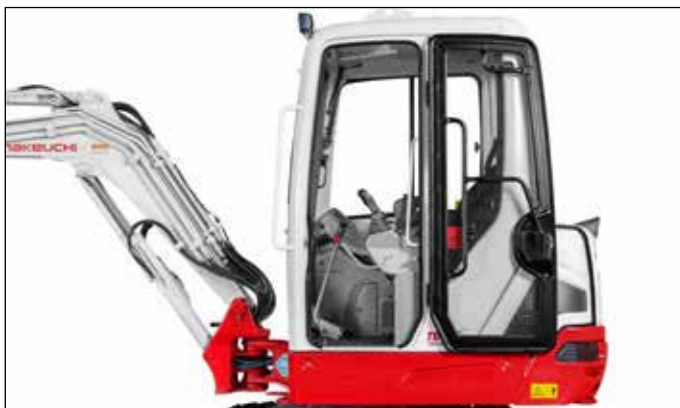
Cabina amplia insonorizada de baja vibración, con asiento de lujo para un trabajo sin cansancio (asiento resistente a la intemperie en versión Canopy).