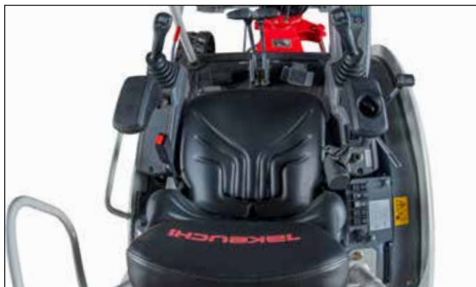
Control proporcional del sistema hidráulico auxiliar a través del joystick derecho e izquierdo.