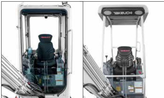
Asiento ergonómico con elementos de mando colocados de manera óptima para trabajar sin cansancio.