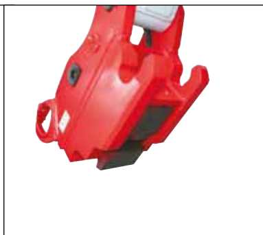
Enganche rápido hidráulico