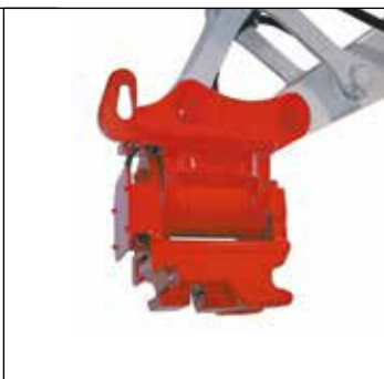
PowerTilt con enganche rápido hidráulico