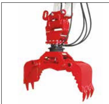
Implemento giratorio PowerTilt con pinza universal