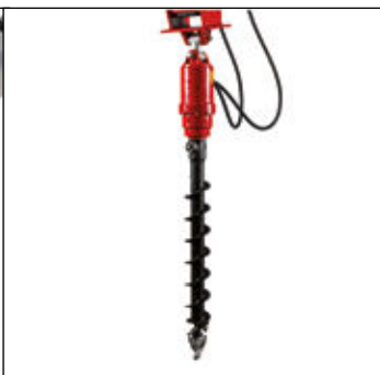
Ahoyador con broca