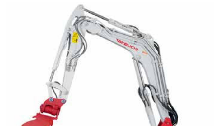
4 circuitos hidráulicos, 3 de ellos dirigidos por potenciómetros, caudal regulable.