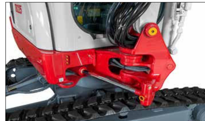
Bloque de giro robusto con cilindro de giro del brazo y latiguillos especialmente protegidos.