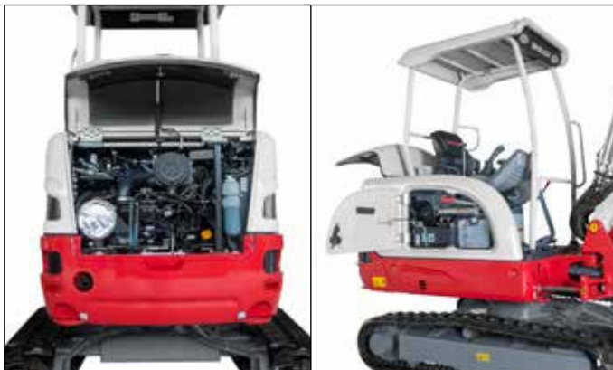
Amplias tapas de mantenimiento para un acceso cómodo a los componentes hidráulicos y al motor.