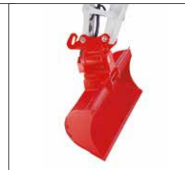
Cazo de limpieza fijo con implemento giratorio PowerTilt