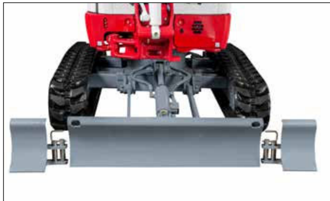
Pala dozer larga de acero antitorsión, ampliable manualmente.