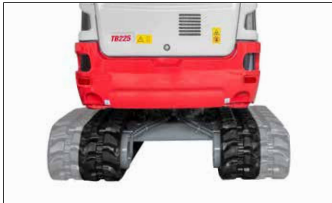
Tren de rodaje con ensanchamiento hidráulico de anchura de vía.