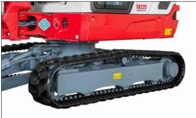
Rodillos con guía interior y exterior para un funcionamiento seguro de las cadenas de goma Double-Short-Pitch que reducen vibraciones.