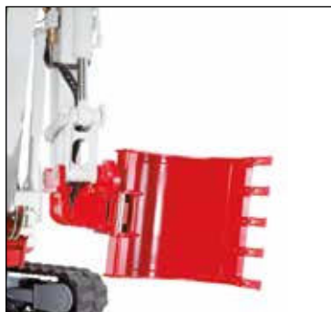
PowerTilt con enganche rápido hidráulico, el cazo puede ser montado también al revés.