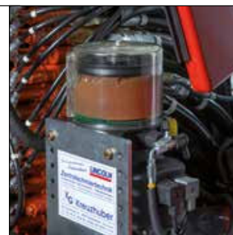
Engrase centralizado con dosificación controlada